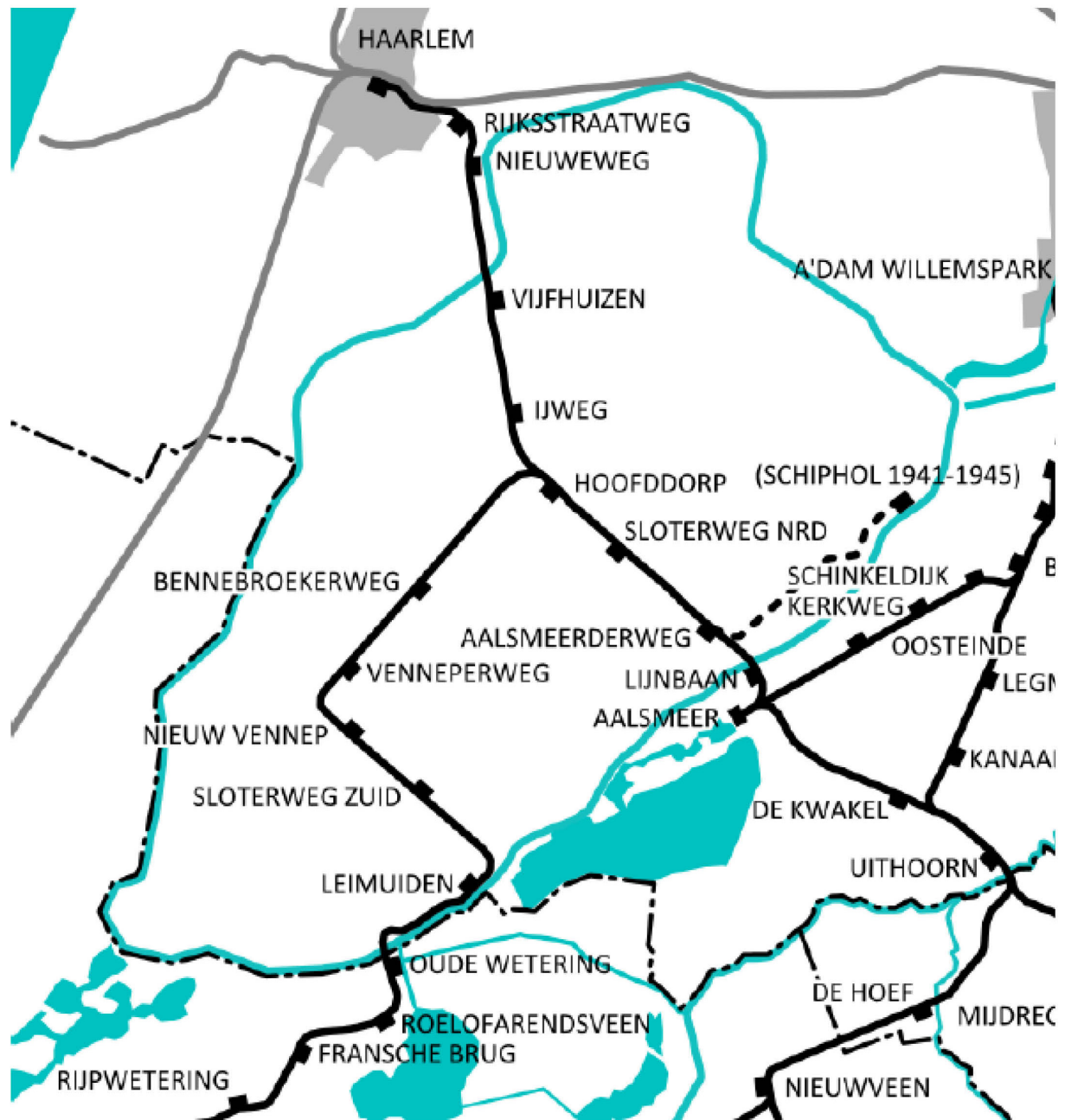
Figuur 12: De Haarlemmermeerspoorlijnen ca. 1930, Door Pbech - Eigen werk, CC BY-SA 3.0, https://commons.wikimedia.org/w/index.php?curid=19841150